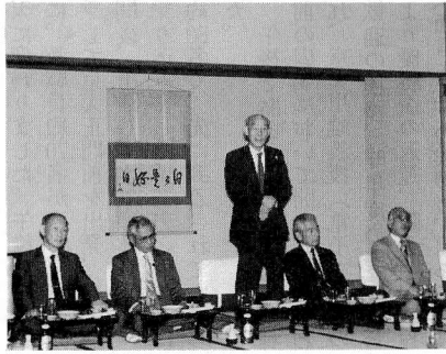
(順不同、敬称略、林 宗明記)

・青木、・石割、・宇尾、・遠藤 門元、○栗原、・重本、・忠末 津田、○東松、○野田、・仁木 室賀、猪川、伊東、・上田、 ○大塚、・久保、佐藤、・鈴木、 塚本、・辻野、○林、原、 堀、吉原、