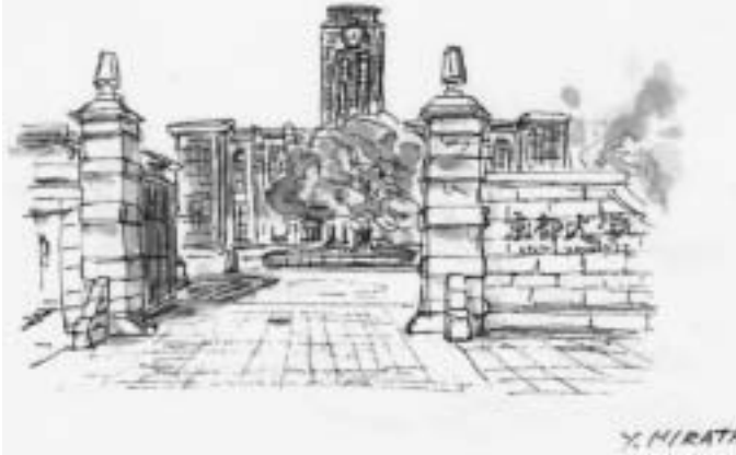
スケッチ2 京大正門前にて