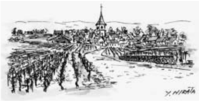
スケッチ1 ロマネコンチにて

話は変わって、所謂「ゆとり教育」が見直されることになりました。ようやく、といった感じがしない訳ではありませんが、有識者と呼ばれる輩の方々が散々議論して出来上がってしまった制度なので、皆がどこかおかしいと気付いていても引くにひけない状況だったことは容易に想像できます。しかし、その悪影響はもう取り返しがつかない状況のようです。子供達はゆとりの時間を何に使ったか。貴重な時間の大部分はゲームへと費やされたようです。加えて小学生に英語を教えようという動きがあるようです。一体誰が仕掛けた何のための陰謀でしょうか。いつも感じるのですが、このような重大な政策の立案者は一体誰なのか、誰が決定の責任を負うのか、国家公務員のうちの誰かなのでしようが、氏名を明らかにした上で